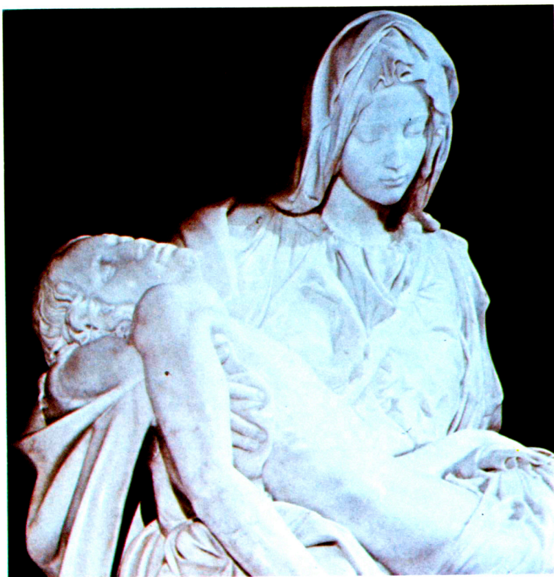
在聖伯鐸大殿中的聖母抱耶穌的屍體石像(PIETA')