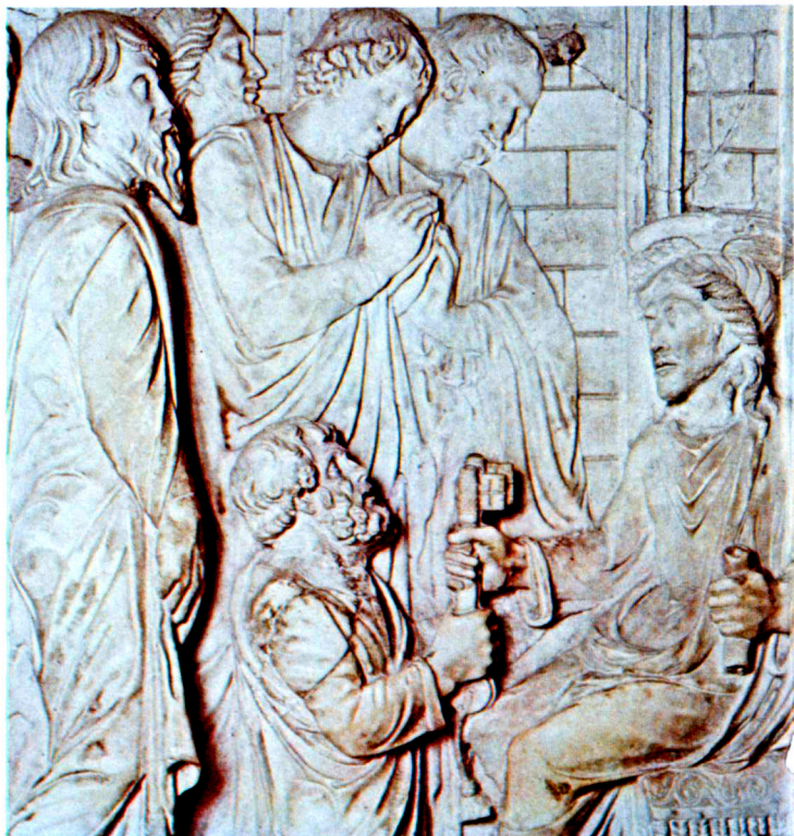
聖伯鐸大殿裏的浮雕，為1479年的作品，伯多祿正接受鑰匙，表示職權與派遣。